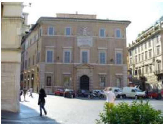
Propaganda Fide in Rom

Information, welchen dogmatischen Sätzen seine Ausführungen widersprächen. Dieser Brief Newmans wurde der Propaganda Fide weitergeleitet, die Anmerkungen zu einzelnen Stellen des Artikels verfasste, zu denen Newman Stellung nehmen sollte. Diese Anmerkungen wurden Newman jedoch nie übermittelt. Er erhielt lediglich einen Brief, in dem ihm mitgeteilt wurde, dass Kardinal Wiseman die Sache für ihn klären würde. In Wirklichkeit aber war gar nichts geklärt: Der Präfekt der Propaganda Fide , Kardinal Barnabò, hielt Newman für ungehorsam, weil er nicht antwortete. Newman wusste nichts Genaues von den Vorwürfen, die gegen ihn erhoben wurden, und konnte sich deshalb nicht rechtfertigen. Die Ultramontanisten hielten Newman für einen gefährlichen Mann. Bekannt sind die Worte von Monsignore Talbot, einem Konvertiten aus England, der als Päpstlicher Kämmerer in Rom tätig war und in einem Brief an Erzbischof Manning einige Jahre später schrieb: „Es ist völlig richtig, dass in Rom eine Wolke über Dr. Newman hängt, seitdem der Bischof von Newport ihn wegen Häresie in seinem Artikel für den Rambler angezeigt hat“. Die Laien würden bald beginn, „den Pferdefuß zu zeigen“ und „die