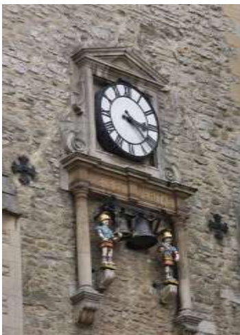
Impressionen von Oxford

Schließlich erwähnt Newman auch seinen Bischof Ullathorne, der in einem Schreiben kurz nach der Verkündigung des Dogmas die Überzeugung der Gläubigen einen „Spiegel“ dessen nannte, was die Hirten lehren. Mit Bezug auf die Stelle in der Mainummer des Rambler , die so vehement angegriffen worden ist, schreibt Newman mit trockener Ironie: „Sehr wohl, so meine ich, kann jemand seinen Spiegel befragen ( consult ) und auf diese Weise etwas über sich selbst erkennen, was er auf keine andere Weise erfahren würde“ 13 .